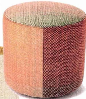
«Shade 3A», pouf en laine, 3 coloris au choix, 690 €. Nanimarquina

Les designers rivalisent d'imagination pour pro- poser des produits aussi confortables que durables.