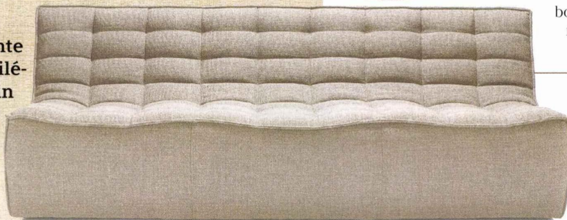
«N701», cana- pé modulable en coton recy- clé, 2 309 €, Ethnicraft

Pour réduire votre empreinte carbone, privilé- giez le made in France.