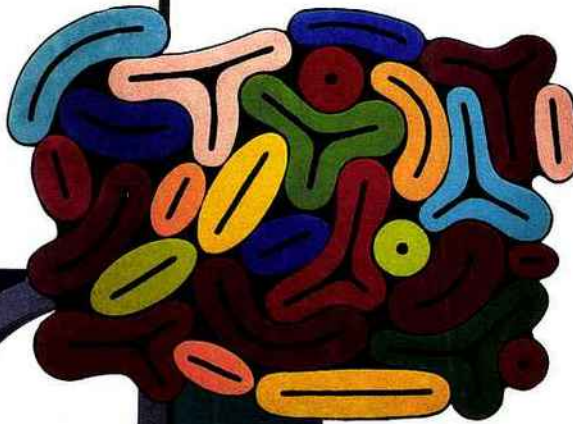
Tapis collection des 60 ans, Joana Vasconcelos pour Roche Bobois.