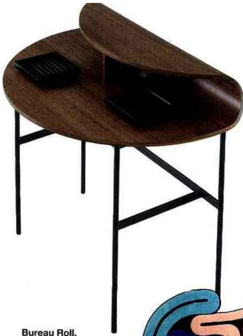
Bureau Roll, Mario Ferrarini pour Cinna.