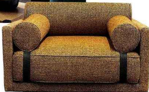
Fauteuil Elsa, Guillaume Hinfray pour Duvivier.